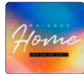
CLASE DE BIENVENIDA A CASA 8.29