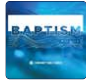
FIN DE SEMANA DE BAUTISMO 8.27 & 8.28