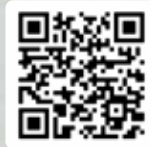
ESCANEA ESTE CÓDIGO PARA UNIRTEEN EL CAMPEONATO NUESTRAS ESCUELAS

Momento de Misión | ¡DEFIENDE A NUESTRAS ESCUELAS! Mientras nuestros estudiantes, educadores y personal se dirigen a un nuevo año escolar, ¡unámonos para "Defender a Nuestras Escuelas"! Este fin de semana, honramos y apreciamos a los increíbles maestros que ayudan a formar la próxima generación de líderes. Continuará el apoyo este próximo domingo, 21 de agosto a las 6:00 PM , nuestra familia de CBC se reúne en varias escuelas en nuestra ciudad para orar y pedirle a Dios que cubra con protección y una en Verdad a nuestras escuelas, estudiantes, educadores, entrenadores, administradores y personal de apoyo. ¡Escanee el código QR para elegir su escuela y orar con nosotros!